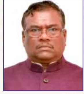
इस्पात राज्य मंत्री भारत सरकार